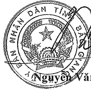
Nguyễn Văn Linh